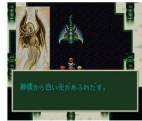
ロードス島戦記クロニクル

© 水野良・グループSNE・出淵裕 発行:株式会社KADOKAWA ©2021 D4Enterprise Co.,Ltd. ©2021 MSX Licensing Corporation All Rights Reserved. 'MSX' is a trademark of the MSX Licensing Corporation.