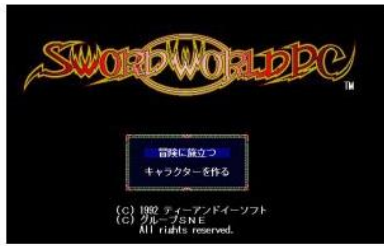
ソード・ワールドPC