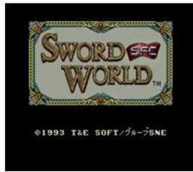
ソード・ワールドSFC