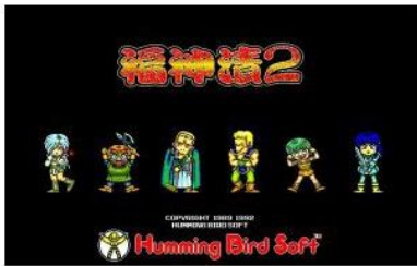
ロードス島戦記 福神漬2