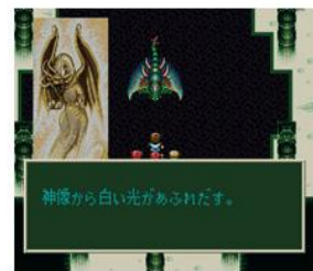
ロードス島戦記クロニクル