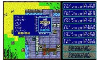
ロードス島戦記クオニクル