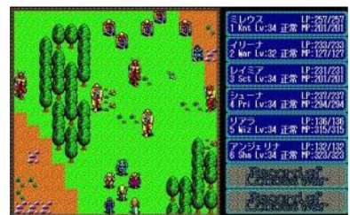
ロードス島戦記クオニクル