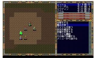
ロードス島戦記クロニクル