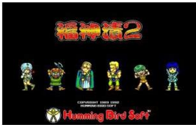
ロードス島戦記 福神漬2