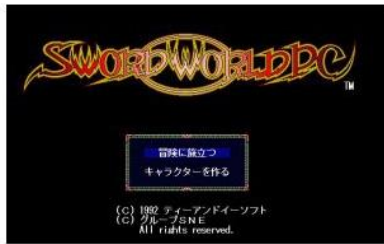
ソード・ワールドPC