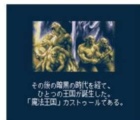
ロードス島戦記クロニクル