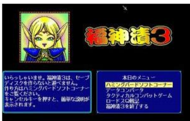
ロードス島戦記 福神漬3