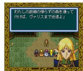
ロードス島戦記クオニクル