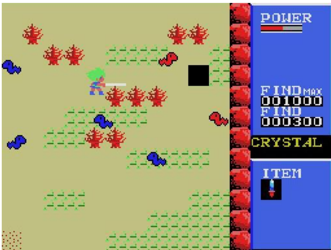
・魔王ゴルベリアス / 真・魔王ゴルベリアス

D4 エンタープライズでは『プロジェクト EGG クリエイターズ』を通じてファンやクリエイターの活動を支援し、レトロゲームマーケットの活性化に努めます。