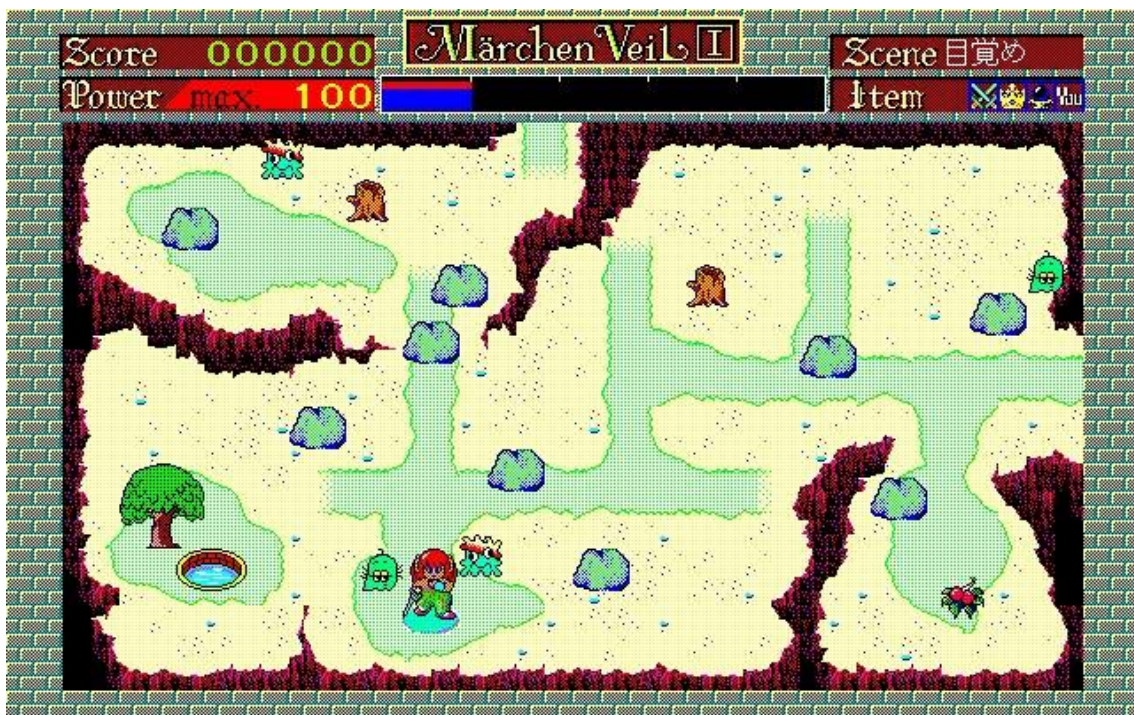
・メルヘンヴェール (BGM は利用できません)